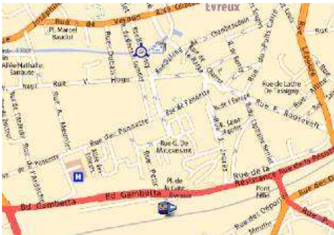
13, rue Henry Ducy 27000 EVREUX

Master 2 Génie Civil Stage de fin de licence en 2009. CDD pendant les congés d'été en 2010. Projet de fin d'étude février à juillet 2011. Embauche définitive juillet 2011 Formateur calcul des structures bois (écoles d'ingénieurs).